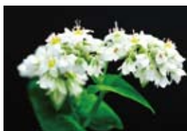
雌しべが長い「長柱花」

そばから周辺に視点を移すと、じつに多種多様な植物と昆虫が関わって、そばという植物が実り育っていることがわかります。