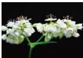
雌しべが短い「短柱花」

種をまいて約1ヵ月後から開花が始まり、虫たちが訪れる。ヤマトシジミ(左上)、アカスジキンカメムシ(右上)。近くで生息するニホンミツバチ(右下)