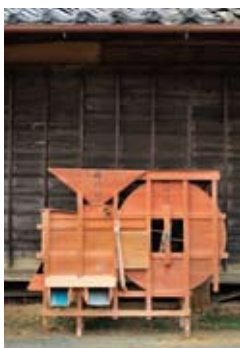
未熟粒や葉、ちりを除去する道具「唐箕(とうみ)」

北海道のような大きな土地のところでは、減反になった田んぼでそばが栽培されていて、大型のコンバインで一斉に刈り取り、同時に乾燥機にかけて乾かすというところも多くなっています。赤土町