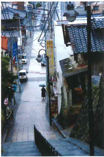
第2回フォトコンテスト 佳作「雨の坂道」高田良昇