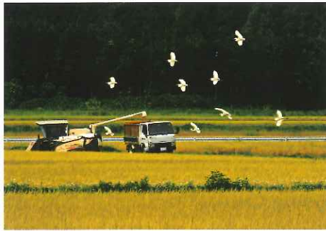
第2回フォトコンテスト 茨城県カメラ商組合長賞「豊作」小野瀬 清三