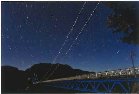
第3回フォトコンテスト 入選「大吊橋に星降って」古橋一郎