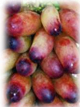
マヌキア フィンガー